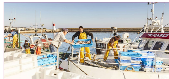
Crée du Guilvinec