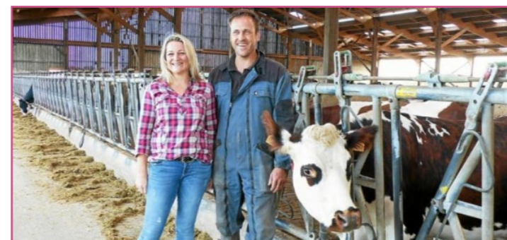
Maison Jeanne et Jean

Vendredi 5 juin de 8h30 à 19h30 Super U Tinténiac, rue du Papeu 35190 Tinténiac bleu-blanc-coeur.org